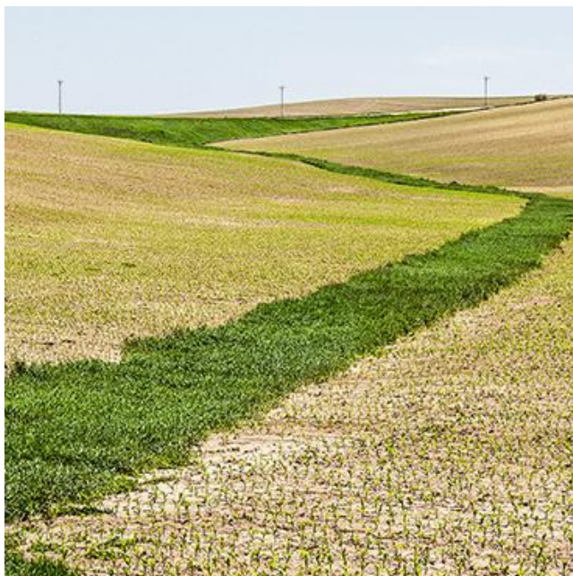
Átművelhető gyepesített vízelvezető