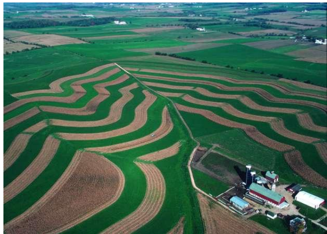
Szintvonalak mentén kialakított sávos (szalagos) művelés (forrás: wpr.org/research-project-study-link-between-farms-climate )