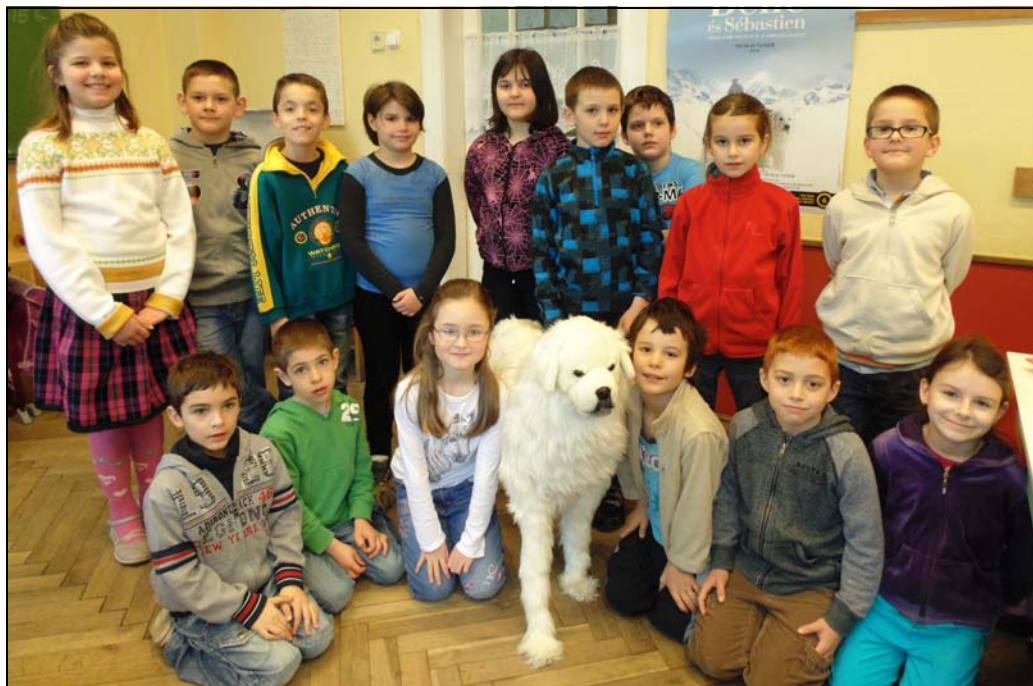
A másodikosok egyik nyereményükkel, Belle élethű másával.

Előző számunkban már beszámoltunk arról, hogy a 2. osztály a Móra Kiadó pályázatán első helyezést ért el saját készítésű, a Belle és Sebastien c. regényhez kapcsolódó kreatív könyvével. A díjátadóra március 7-én került sor Budapesten, melynek keretében az osztály megnézhetette a regény alapján készült mozifilmet is.