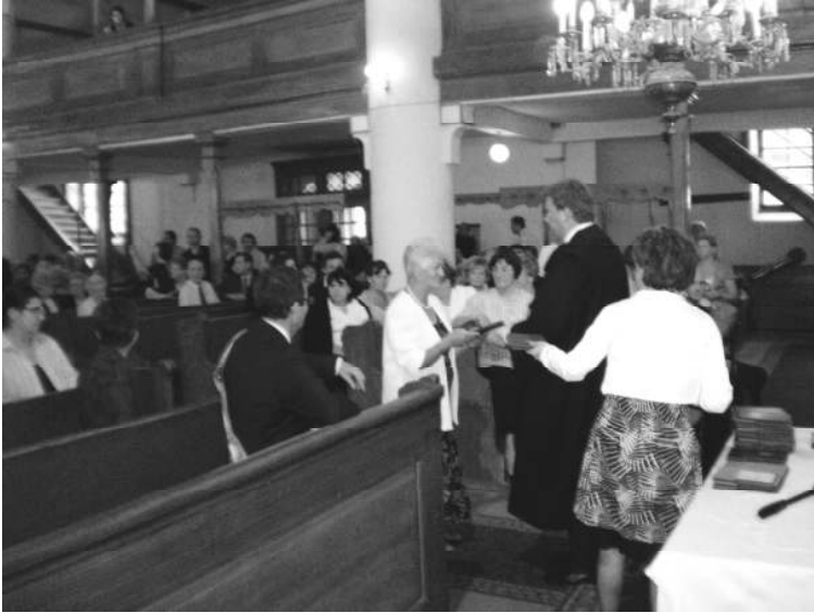
Az aranydiploma ünnepélyes átadása-átvétele

Egy alkalommal hajnali 4 órakor jöttek az óvo-