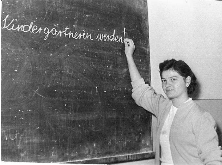
18 évesen az iskolai táblánál. Óvónó szeretnék lenni

1946-ban, hat évesen Ő is a kitelepítendőekkel együtt ült a Németországba induló vonaton, a leányvári vasútállomáson. (III/270 besorolási számmal szerepel a kitelepítési listán) A bányász apa élt az utolsó pillanatban felkínált lehetőséggel. „Aki bányász, az itthon maradhat” szöveget az ígéret. A