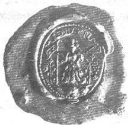
Leányvár pecsétje. 18–19. század

szerint bírja. Mária Terézia híres, csallóközi huszárcapitányból lett generálisa, Hadik András, 1757-ben sziléziai harcaiból elportyázott Berlinig, és azt egy napra elfoglalva visszatért Sziléziába. A császárnő nagyra értékelte Hadik huszárbavúrját, és a Mária Terézia Rend nagykeresztjével, valamint gazdag jutalommal honorálta a kalandot, majd kinevezte őt az Udvari Haditanács elnökévé. Egész Európa megmosolyogta a porosz királyt, miközben a trónörökös, József, példaképének tekintette őt.