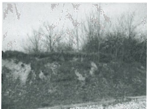
Utcafront 2.JPG 729K