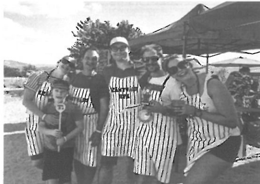
A bográcsfőző verseny nyertes csapata