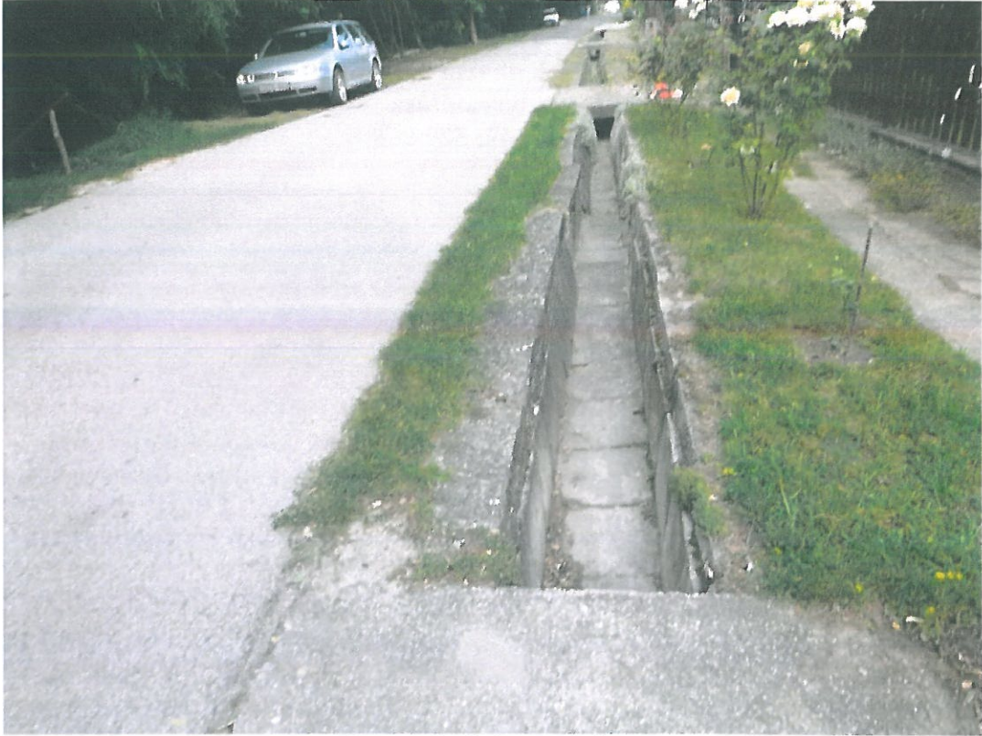
3. kép – Kálvária u. 316/3 hrsz.