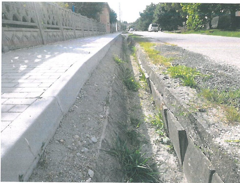
1. kép – Erzsébet u. 233 hrsz.

Leányvár, 2021. július 17-i esőzések okozta "vis maior" jellegű út-, és árokkárok helyreállítása EBR42: 529 965