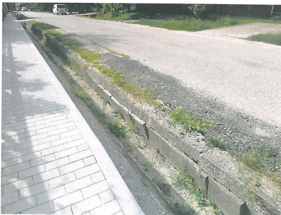
2. kép - Erzsébet u. 233 hrsz.