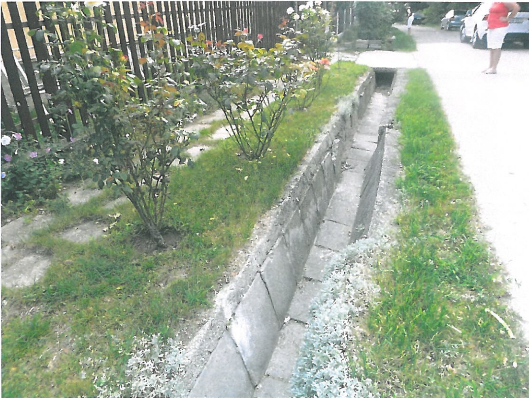
4. kép - Kálvária u. 316/3 hrsz.