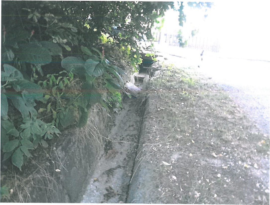
5. kép – Kálvária u. 339/2 hrsz