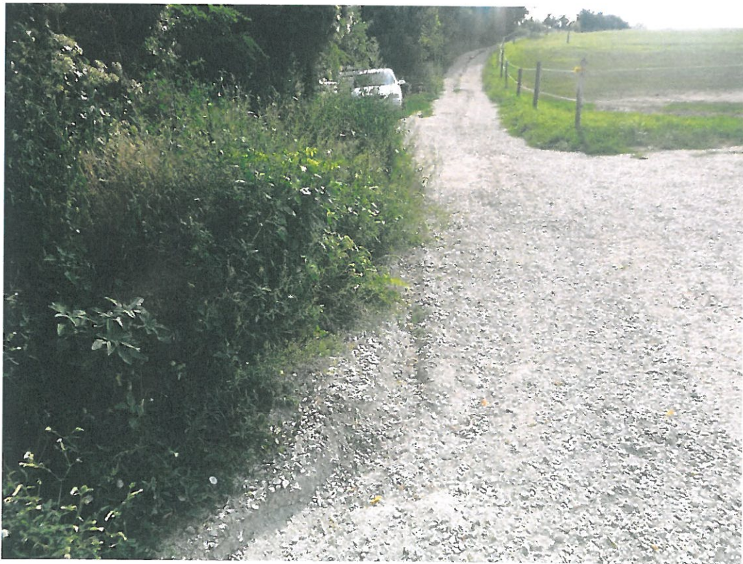
6. kép – 1125 hrsz. út (066/1 hrsz.)