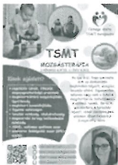
Egyéni TSMT plakát Leányvár (2).png 2409K