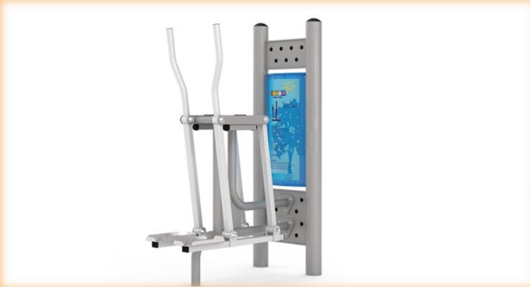
- Síelő gép