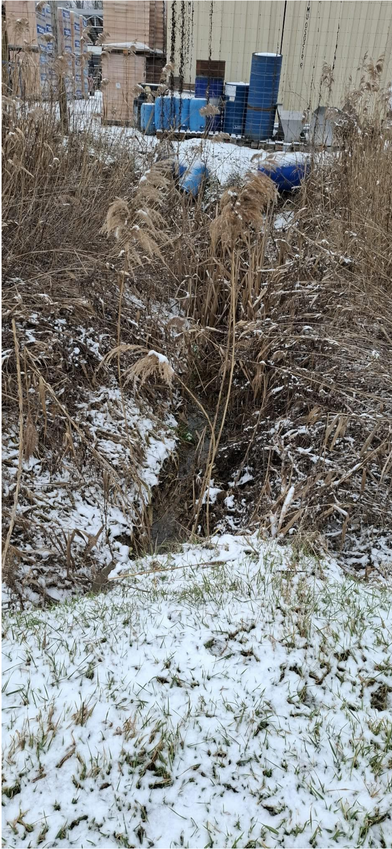
A patak szabad vízfolyása biztosított az áteresszel.